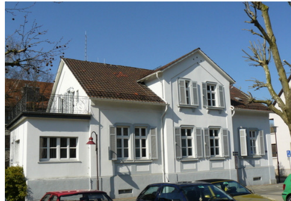
Das Martin Buber-Haus in Heppenheim