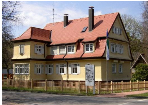
Das Albert Schweitzer-Haus in Königsfeld