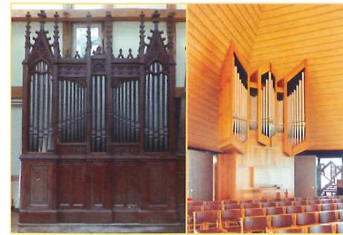
links: Orgel Charles Mutin II/9 1892, Königsfeld-Neuhausen, katholische Kirche St. Martin

Ein „Orgelspaziergang“ in und um Königsfeld gilt zwei Instrumenten französischer Provenienz: Besucht werden eine Orgel der elsässischen Werkstatt Koenig, Sarre-Union (2000, II/20) und ein kleines Instrument des Cavaillé-Coll-Schülers Charles Mutin (1892, II/8). Auf diesen Orgeln wird Wolfgang Baumgratz Musik von Mendelssohn und Franck spielen.